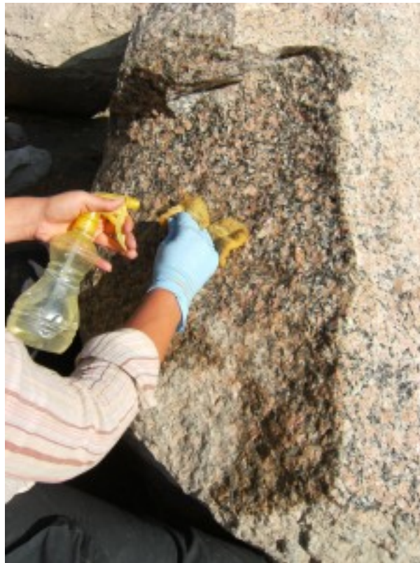
Nettoyage d'un bloc avec de l'eau et une éponge

En ce qui concerne les blocs de Touy, après leur assemblage la différence d'aspect de surface est clairement apparue. A ce jour, nous avons réalisé des essais de nettoyage à l'aide de brosses à sec et à l'eau, par microabrasion. Ces méthodes sont en cours d'évaluation ; le nettoyage aura lieu après l'intervention des travaux de taille et de sculpture.