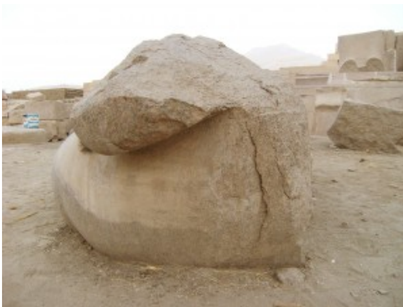
Bloc de Ramsès