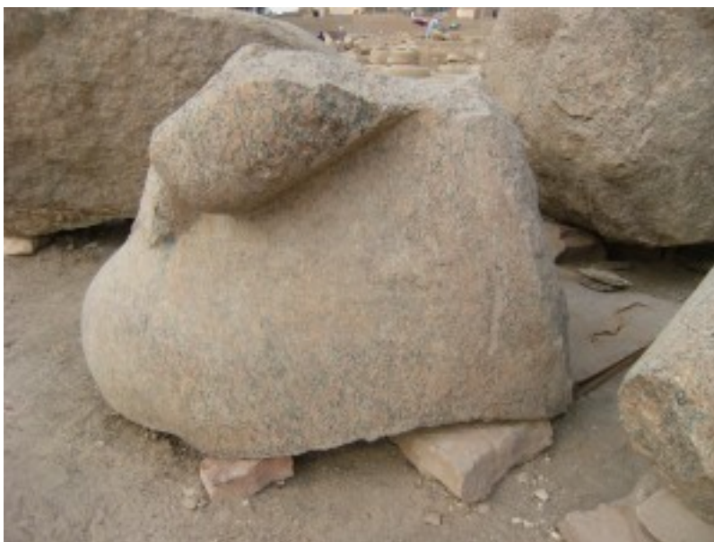
Bloc de Ramsès II (R4) après la restauration